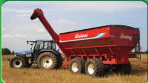
Зернові бункери Cestari