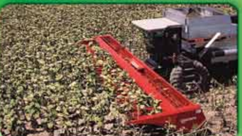
Соняшникові жатки Mainero