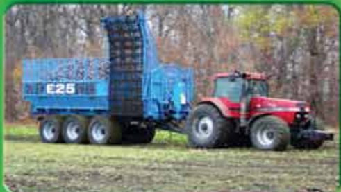
Бункери для буряку та зерна 2 в 1