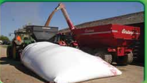
Пакувальники сухого та плющеного зерна, мішки