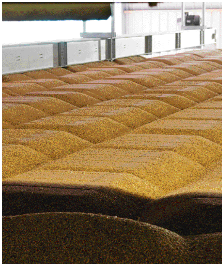
Зерно в механизированном напольном складе

[REDACTED]) в АНС на 20-40% ниже, чем в силосе, ввиду меньшей себестоимости строительства АНС по сравнению с баночным элеватором.