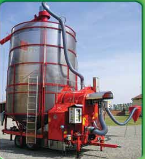
Мобільні зерносушарки Pedrotti

Ярослав (менеджер), тел.: (067) 52 00 458, Світлана (директор), тел.: (067) 52 00 529,